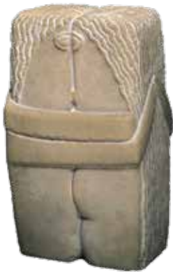
კონსტანტინ ბრანკუში, „კოცნა“, 1913 წ.