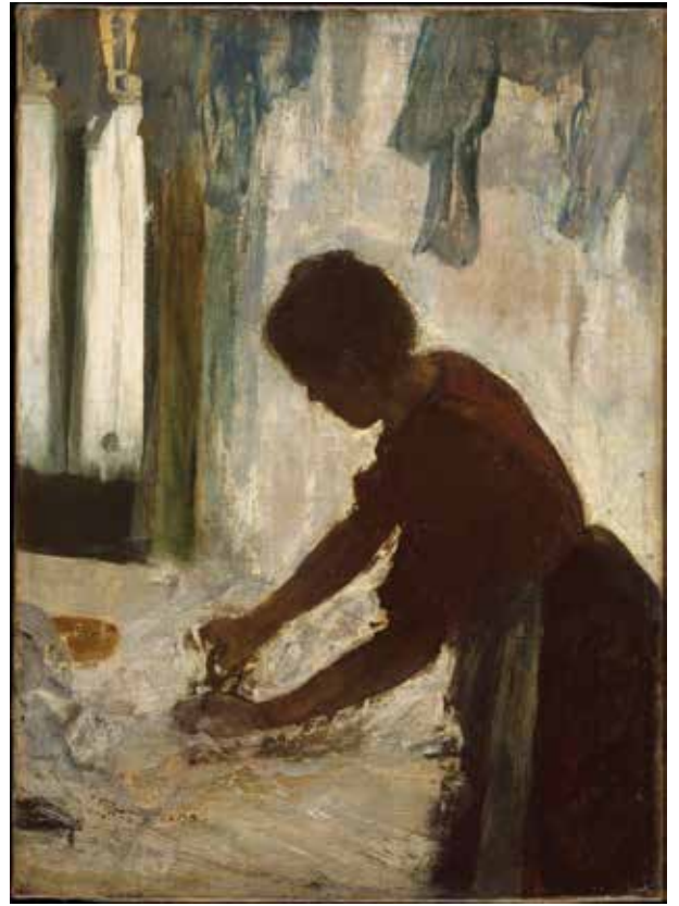
ედგარ დეგა, „დაუთოება“, 1884 წ.