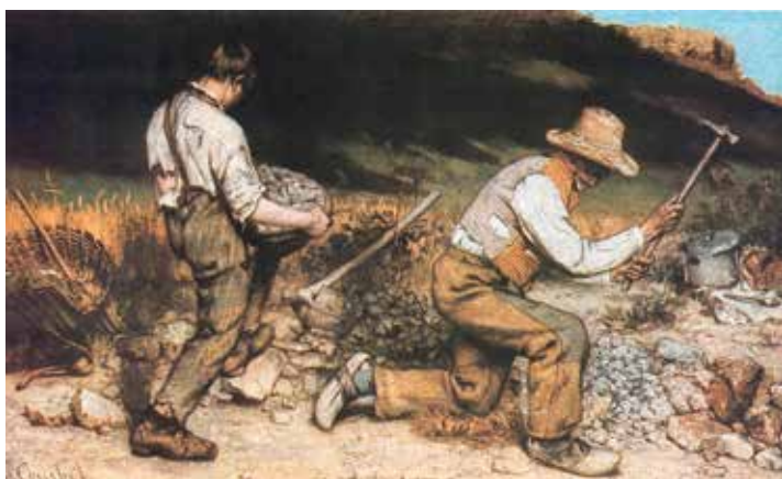
გუსტავ კურბე, „ქვის მტეხელები“, 1849 წ.