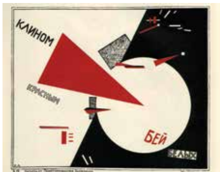
ელ ლისიცკი, „წითელი სოლით დასცხე თეთრებს“, 1919 წ.