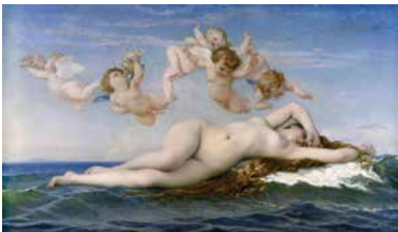
ალ. კაბანელი, „ვენერას დაბადება“, 1863 წ.