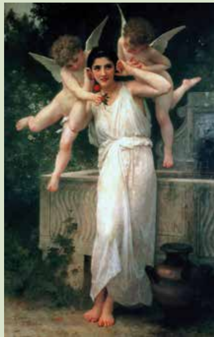
უილიამ ადოლფ ბუგრო, „სიყმანვილე“, 1893 წ.

მინც ვინ იყვნენ ეს აკადემიკოსები, რომლებიც წყვეტდნენ, რა იყო მაღალი ხელოვნება და რა – არა?