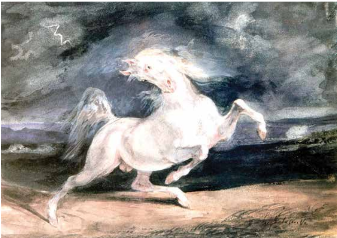
ეჟენ დელაკრუა, „ქარიშხლით შეშინებული ცხენი“, 1824 წ.

როგორი მონასმებითაა დახატული ზღვის ზედაპირი. მომდევნო თავებში არაერთხელ წააწყდები ამ პატარა ნიუანსის გავლენის კვალს სხვადასხვა მხატვრის შემოქმედებაში.