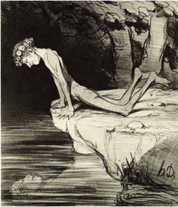
ონორე დომიე, „ნარციზი“, 1842 წ.

გადახედე ილუსტრაციებს, დააკვირდი თემებს, პერსონაჟებს, წერის მანერას. აკადემიკოსებისა და კლასიციზტებისგან განსხვავებით, რა სიახლე გაჩნდა ახალი თაობის მხატვრების შემოქმედებაში და რატომ?