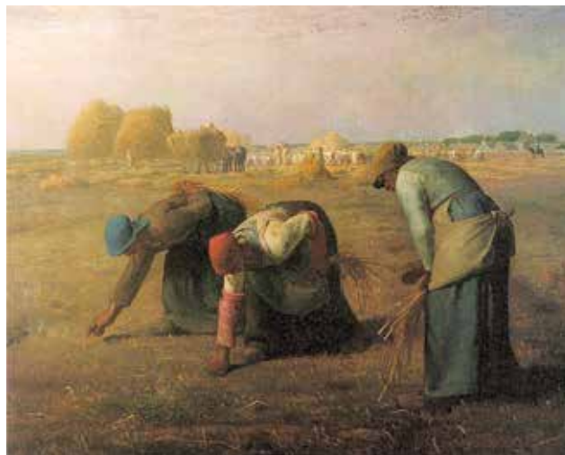
ჟ-ფ. მილე, „მარცვლეულის ამკრეფნი“, 1857 წ.