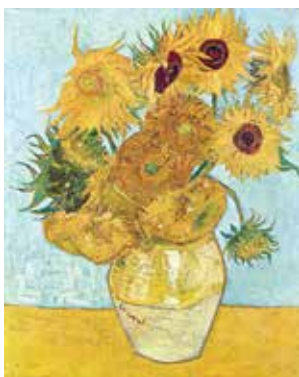
ვინსენტ ვან გოგი, „მზესუმხირები“, 1888 წ.