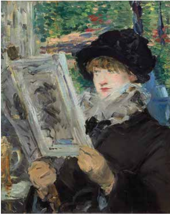
ედუარდ მანე, „კითხვის დრო“, 1881 წ.