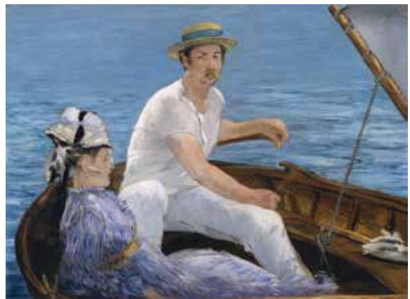
ედუარდ მანე, „ნაეში“, 1874 წ.