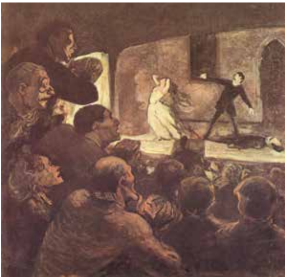
ონორე დომიე, „მელოდრამა“, 1860 წ.

აკადემიზმის ქომაგებს ახალი თაობის სითამამე მაღალი ხელოვნების წინააღმდეგ ჩადენილ დანაშაულად მიაჩნდათ. მით უფრო, რომ რეალისტებისა და იმპრესიონისტების ინტერესის საგანი არა ღმერთები ან ისტორიული გმირები, არამედ ჩვეულებრივი ადამიანები და მათი ყოველდღიური ცხოვრება გახდა. რატომ? იმიტომ, რომ ამ დროს გაღვრებულსა და სალონებს მიღმა სულ სხვა ცხოვრება ჩქეფს – საფრანგეთში რევოლუციამ დაამხო მონარქია, ორთქლმავალი ხომალდები ოკეანეებს სერავენ, ცაში დირიჟაბლები, ქუჩებში ავტომობილები, ხოლო მინის ქვეშ მეტროს ვაგონები დაქრიან, ტელეგრაფი და ტელეფონი კონტინენტებს აკავშირებს, ელექტროენერგიამ ღამე ღღედ აქცია, ფოტოგრაფები კი თითის ერთი დაჭერით იღებენ სურათს, რომლის შექმნასაც მხატვარი თვეებს მოანდომებდა. მალე ბიპლანიც აფრინდება ცაში და ძმები ლუმიერები პირველ ფილმს გადაიღებენ. ტექნიკურმა პროგრესმა სამყარო შეცვალა. შეიცვალა ადამიანის ინტერესები, ცხოვრების წესი და რიტმი.