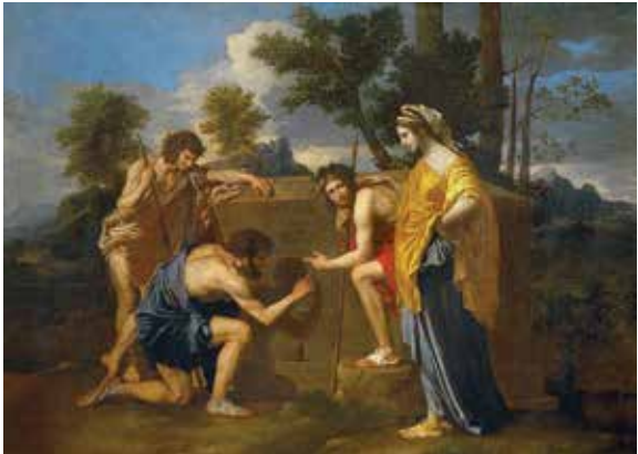
ნიკოლა პუსენი, „არკადიელი მწყემსები“, 1638 წ.

ბერძნულ-რომაული მითების თუ ცხოვრების სტილის სიმულაცია, „ანტიკურობანას“ თამაში – ასეთი იყო იმდროინდელი ბურჟუაზიის გემოვნება, ამ გზით ცდილობდნენ ისინი, არისტოკრატებს გასტოლებოდნენ. მაგრამ როგორ გგონია, რამდენ ხანს გასტანდა ეს „კოსტიუმირებული მასკარადი“? საქმე მხოლოდ დროს აცდენილ, წარსულში ჩარჩენილ სიუჟეტებში როდია. ახალი რეალობიდან გაღერებაში შესულ დამთვალიერებელს იქ ისევე ძველი მითების ამსახველი სურათები, მშვენიერი ვენერები და ფუმფულა კუპიდონები ხვდებოდნენ, რომლებიც შორს იყვნენ ამ სახეცვლილი სამყაროსგან. არადა, ის, რასაც გარშემო ყოველდღიურად ვხედავთ, სულაც არ არის ასე საგანგებოდ დალაგებული.