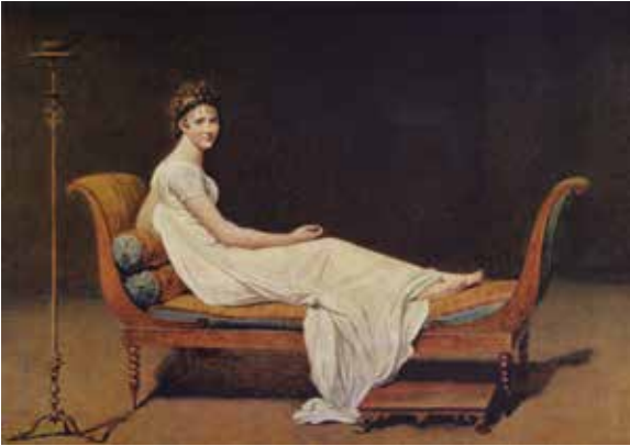
ჟაკ-ლუი დავიდი, „მადამ რეკამიეს პორტრეტი“, 1800 წ.

1 უპასუხე რომელ ჟანრს განეკუთვნება ბუგროს სურათი „ხელოვნება და ლიტერატურა“?