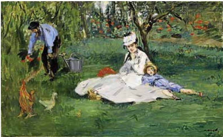
ედუარდ მანე, „მონეს ოჯახი ბალში, არჟანტეი“, 1874 წ.