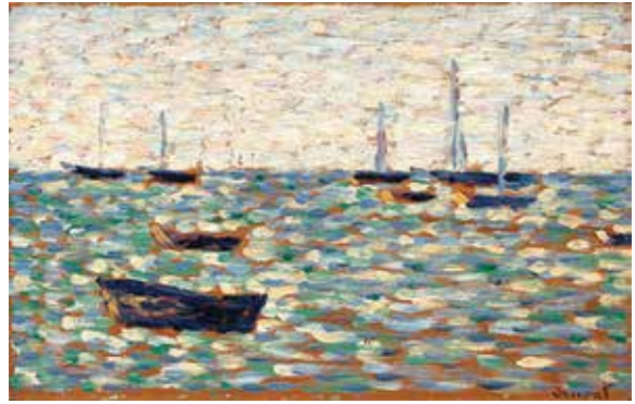
ჟორჟ სიორა, „ზღვა გრანდკამში“, 1885 წ.