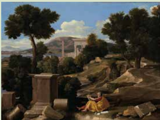
ნიკოლა პუსენი, „იოანე ნათლისმცემელი კუნძულ პატმოსზე“, 1640 წ.

იმსჯელე, როგორ შეიცვალა მხატვრების დამოკიდებულება და მათ წინაშე მდგარი ამოცანები გარემოს ასახვის ხერხებისადმი.