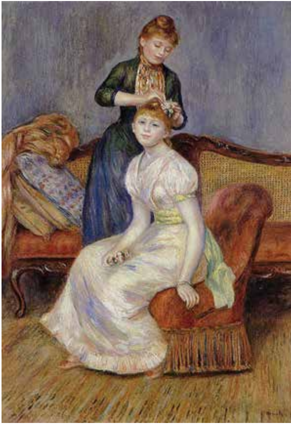
ოგუსტ რენუარი, „ვარცხნილობა“, 1888 წ.