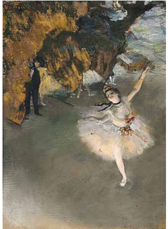
ედგარ დეგა, „ვარსკვლავი“, 1878 წ.