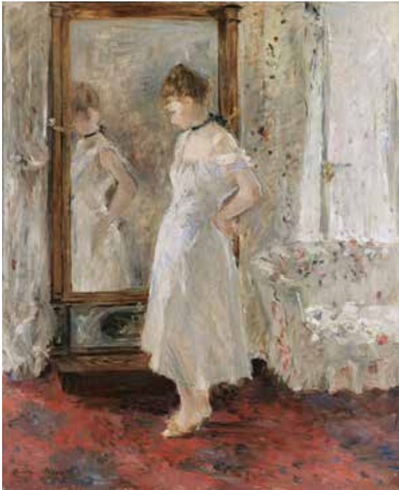
ბერტა მორიზო, „სარკე“, 1876 წ.