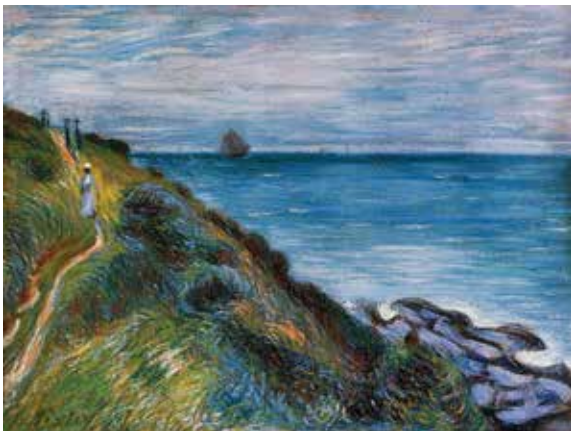
ალფრედ სისლეი, „კლდეზე“, 1897 წ.