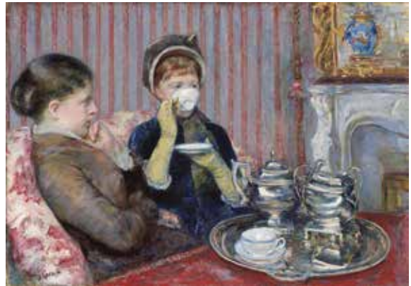
მარი კასატი, „ჩაი“, 1880 წ.