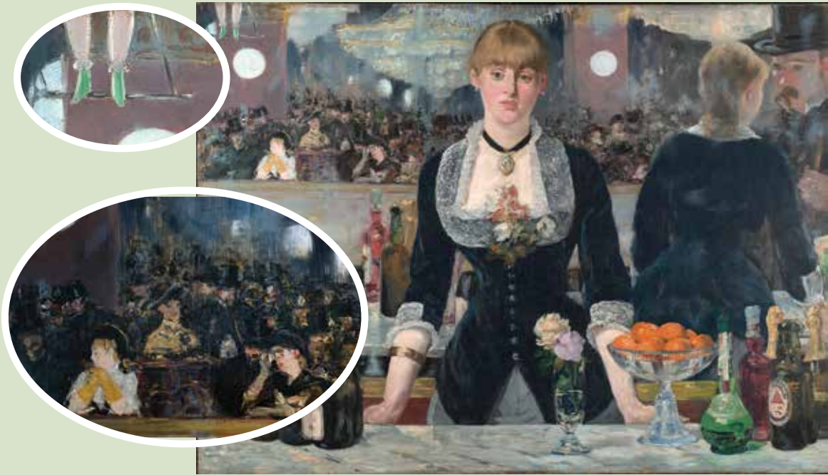
ედუარდ მანე, „ბარი ფოლი-ბერჟერი“, 1882 წ.

დააკვირდი ილუსტრაციას. აკადემიური ფერწერისგან განსხვავებით, რა სიახლეს ამჩნევ სიუჟეტში, პერსონაჟის დახასიათებაში, წერის მანერაში? რა შეიძლება ყოფილიყო ამ ცვლილების მიზეზი? რა რეაქციას გამოიწვევდა ედუარდ მანეს ეს ნამუშევარი აკადემიკოს მხატვრებში? როგორ შეაფასებდა მას ახალი, პროგრესულად მოაზროვნე თაობა?