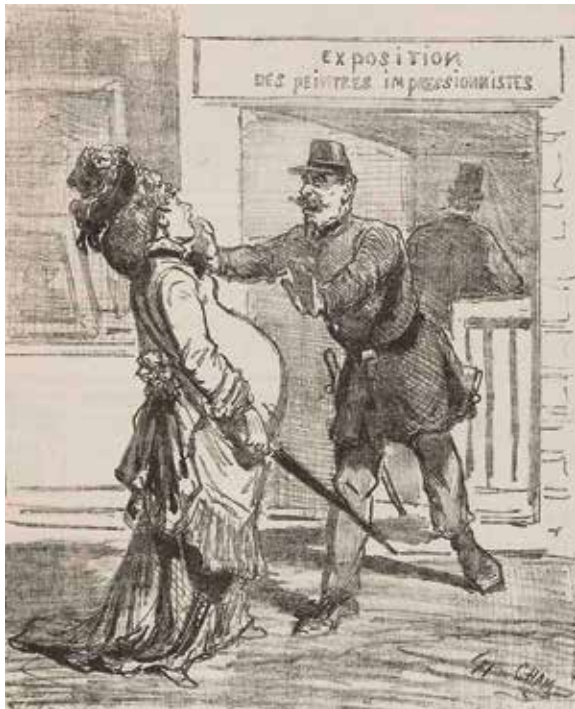
კარიკატურა ფრანგული ჟურნალიდან

არც კრიტიკოსები იშურებდნენ სალანძღავ სიტყვებს.