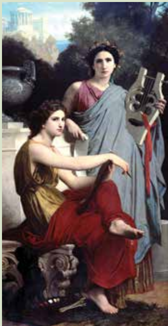
უილიამ ადოლფ ბუგრო, „ხელოვნება და ლიტერატურა“, 1867 წ.

იმისთვის, რომ იმპრესიონისტების გარშემო ატეხილი ვნებათაღელვის მიზეზი გავიგოთ, გადავხედოთ, რა ხდებოდა მხატვრობაში იმპრესიონისტებამდე. დააკვირდი აკადემიკოსი მხატვრების უილიამ ადოლფ ბუგროსა და ალექსანდრ კაბანელის ნამუშევრების პერსონაჟებს, კომპოზიციის აგებულებას, წერის მანერას. როგორ ფერწერას ამკვიდრებდნენ ისინი?