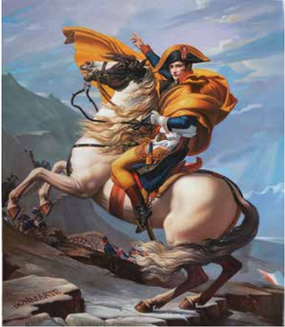
ჟაკ-ლუი დავიდი, „ნაპოლეონ ბონაპარტი“, 1800 წ.