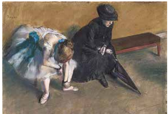
ედგარ დეგა, „მოლოდინი“, 1882 წ.