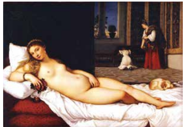
ტიციანი, „ურბინოს ვენერა“, 1534 წ.