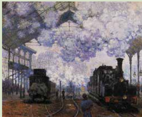
კლოდ მონე, „სენტ ლაზარის სადგური“, 1877 წ.

XIX საუკუნიდან მოყოლებული დღემდე, გარემო სულ უფრო სწრაფად იცვლება.