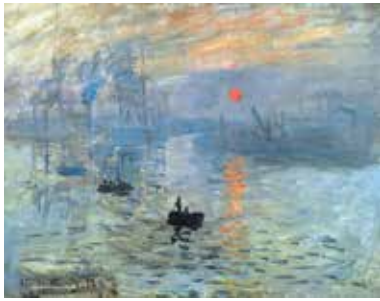
კლოდ მონე, „შთაბეჭდილება. მზის ამოსვლა“, 1872 წ.