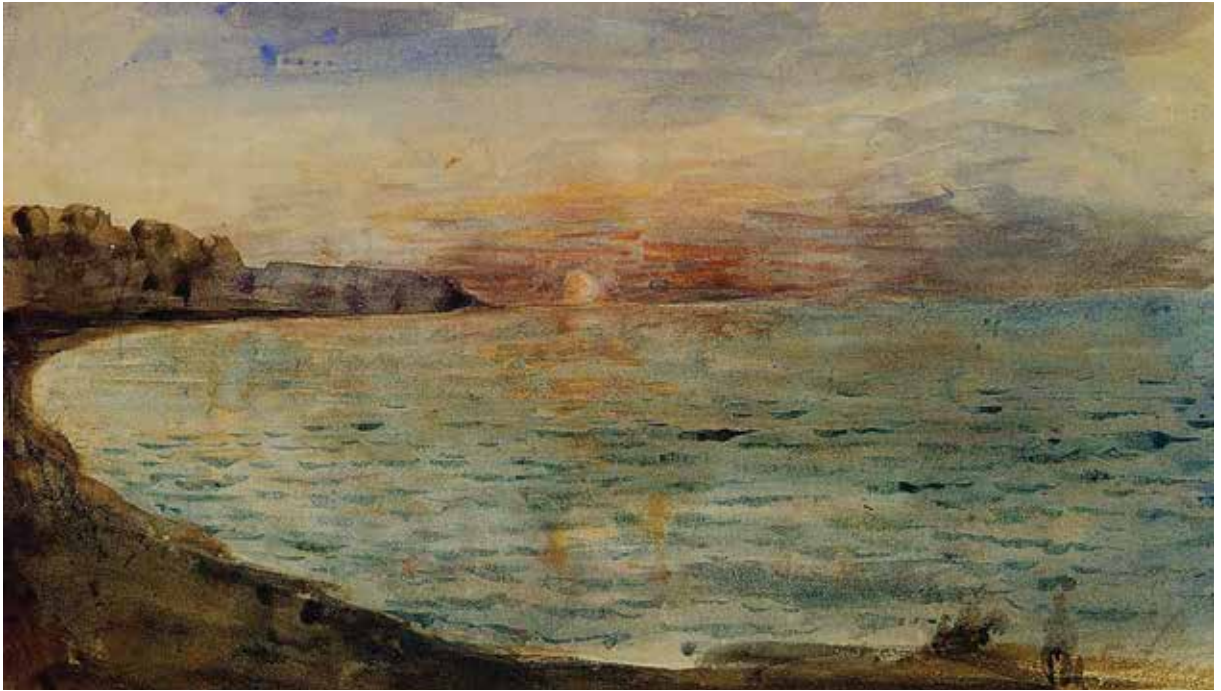
ეჟენ დელაკრუა, „დიეპის კლდეები“, 1855 წ.

ეჟენ დელაკრუას აკვარელი „დიეპის კლდეები“ იმპრესიონისტ კლოდ მონეს ისე მოეწონა, რომ სურათი თავისი კოლექციისთვის შეიძინა. დააკვირდი და დაიმახსოვრე,