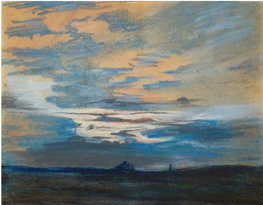
ეჟენ დელაკრუა, „მზის ჩასვლა“, 1850 წ.

დელაკრუას მხატვრობა ყველა ჟანრს მოიცავს. განსაკუთრებით მძაფრია ბუნების ამსახველი სურათები, რომლებშიც რომანტიკოსის მგზნებარე, შეუპოვარი, მებრძოლი სულისკვეთება ჩანს.