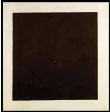
კაზიმირ მალევიჩი, „სუპრემატისტული შავი კვადრატი“, 1915 წ.