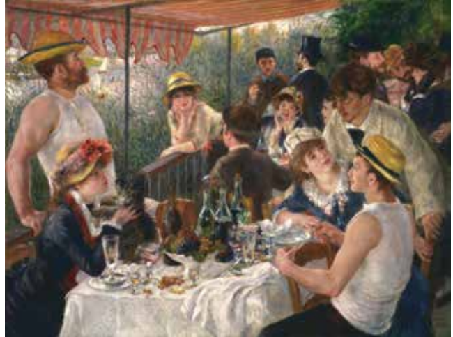
ოგიუსტ რენუარი, „მენავეების საუზმე“, 1881 წ.

დააკვირდი ილუსტრაციებს, რა ახალი თემებითა და სიუჟეტებით გამდიდრდა მხატვრობა? რატომ არ მიაჩნდათ აკადემიკოსებს ეს სიუჟეტები და პერსონაჟები ასახვის ღირსად?