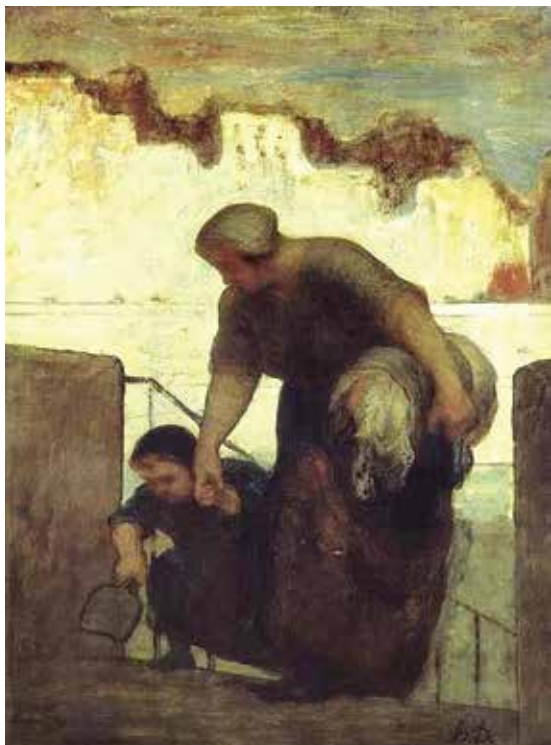
ო. დომიე, „მრეცხავი“, 1863 წ.

იმპრესიონისტების წინამორბედმა, რეალისტმა მხატვრებმა უკვე შეამზადეს ნიადაგი – გუსტავ კურბე, ჟან-ფრანსუა მილე და ონორე დომიე ადამიანების ყოფას ხატავდნენ შეულამაზებლად, ისე როგორც ამას გარშემო ხედავდნენ.