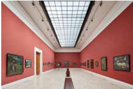
თბილისი, ეროვნული გალერეა