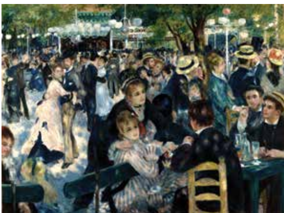
ოგიუსტ რენუარი, „მულენ დე ლა გალეტი“, 1876 წ.