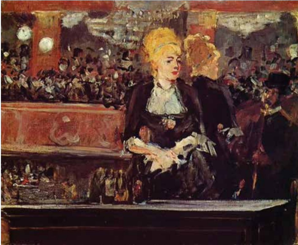
ედუარდ მანე, ესკიზი სურათისთვის „ბარი ფოლი-ბერჟერი“, 1882 წ.

ხედავ, რამდენი რამის მოყოლა შეუძლია ნანარმოებს ისტორიული ვითარების შესახებ, თუკი მას ყურადღებით დავაკვირდებით!