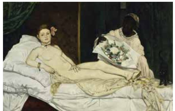
ედუარდ მანე, „ოლიმპია“, 1863 წ.

1865 წელს, მაშინ როცა ხელოვნებაში შიშველი ნატურით ვერავის გააკვირვებდი, პარიზის სალონში ედუარდ მანეს სურათის „ოლიმპიას“ გამო დიდი სკანდალი აგორდა. რით განსხვავდებოდა მანეს ოლიმპია იმ „ვენერების“, „მობანავე ქალების“ და სხვა ნიუებისგან, რომლებიც XIX ს-ის შუა წლებში ყველა ოფიციალურ გამოფენას ამშვენებდნენ? აღტაცებული დამთვალიერებლები