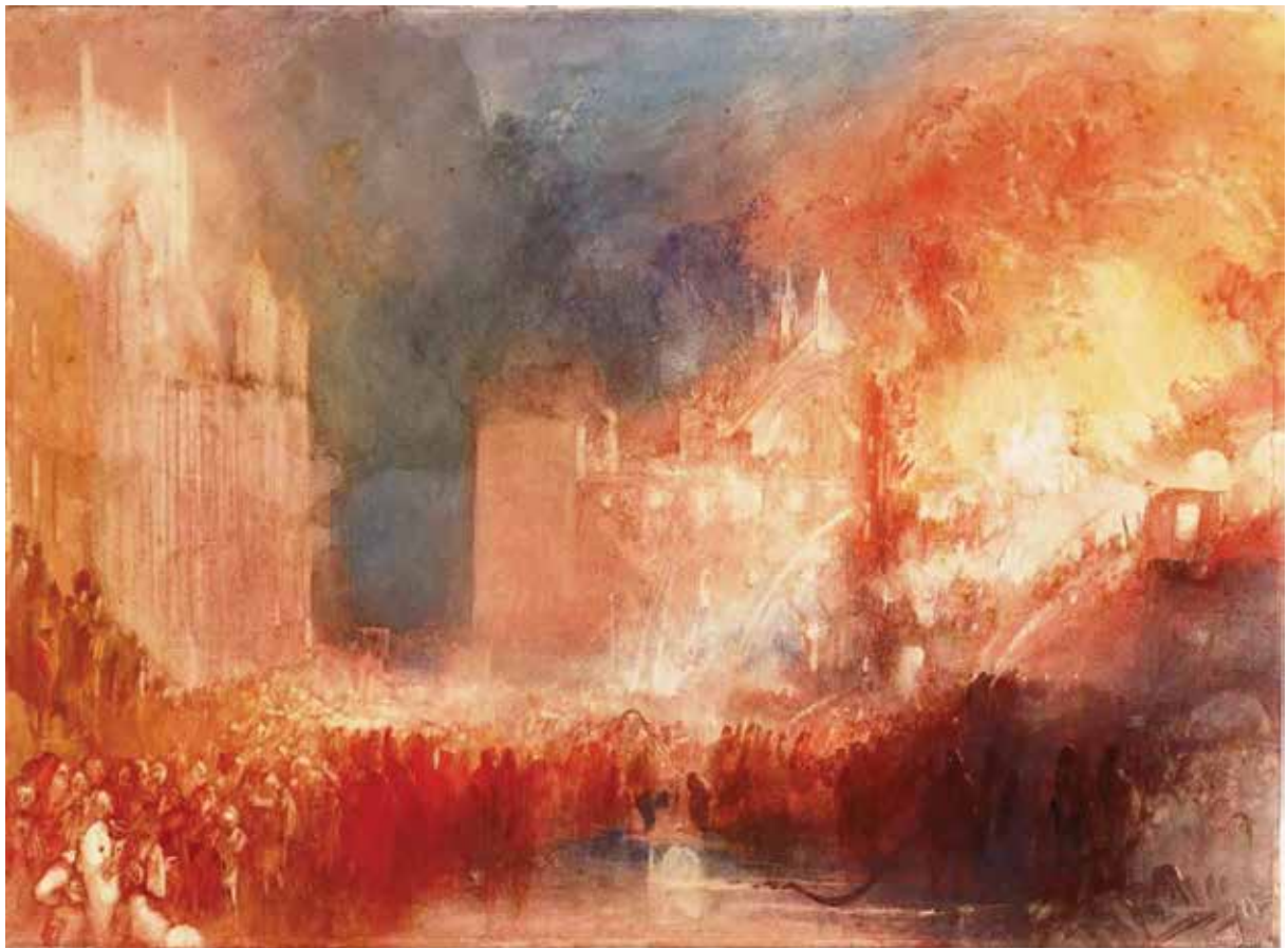
უილიამ ტერნერი, „ლონდონის პარლამენტის ხანძარი“, ესკიზი, 1834 წ.

უილიამ ტერნერი იმპრესიონიზმის წინამორბედად ითვლება.