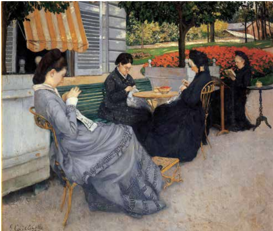
გუსტავ კაიებოტი, „პორტრეტები სოფელში“, 1876 წ.