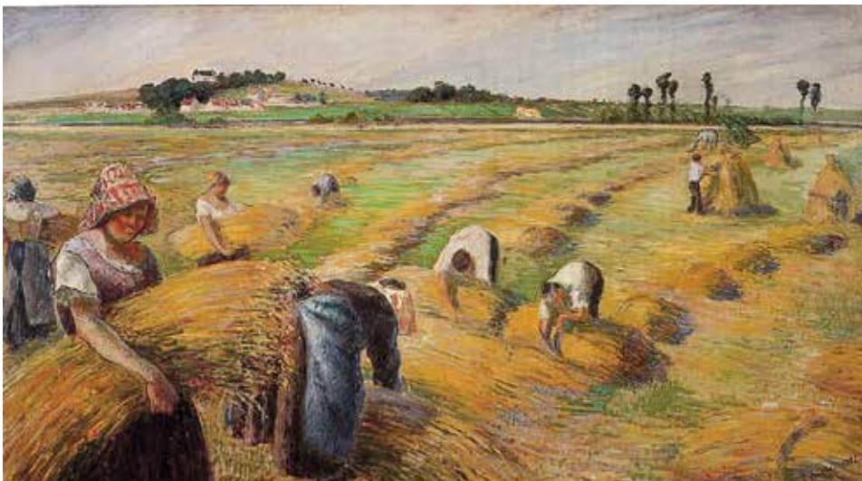
კამილ პისარო, „მოსავლის აღება“, 1882 წ.