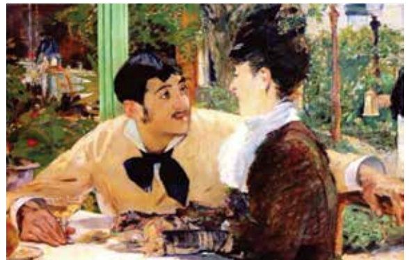
ედუარდ მანე, „კაფეში“, 1879 წ.

იმპრესიონისტებმა რეალისტების გზა განაგრძეს, ოღონდ უფრო თამამი სახვითი ხერხებით.