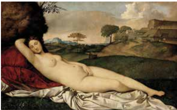
ჯორჯონე, „მძინარე ვენერა“, 1510 წ.