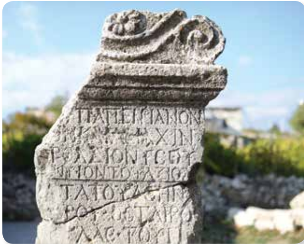
ეს ძველბერძნული წარწერა შემორჩენილია ათენის ტაძარზე.

ბერძნული დამწერლობის უძველესი ნიმუშები ძვ. წ. მე-8-მე-7 საუკუნეებით თარიღდება. ბერძნული დამწერლობა ამ დროისათვის თითქმის უცვლელად იყენებდა ფინიკიური დამწერლობის ნიშნებს. თანდათან კი შეიცვალა გრაფემების ფორმები, შეიცვალა წერის მიმართულებაც – ბერძნებმა დაიწყეს წერა მარცხნიდან მარჯვნივ, როგორც ჩვენ ვწერთ დღეს. ხოლო ძველი ნელთაღრიცხვის 403 წელს ათენში ბერძნულმა ანბანმა ის სახე მიიღო, რომლითაც დღეს ჩვენთვის ცნობილია ძველი ბერძნული ანბანი.