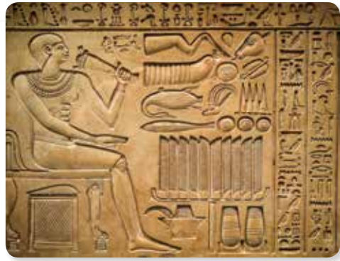
ეს ბარელიეფიც ერთ-ერთ ეგვიპტურ ტაძარზეა შემორჩენილი. აქ გამოსახული ნახატები იეროგლიფებთან ერთად გარკვეულ ინფორმაციას გადმოსცემს.

ენებს საერთო წარმომავლობის მიხედვით აჯგუფებენ ენათა ოჯახებად. საერთო წარმომავლობა ნიშნავს იმას, რომ ერთ ოჯახში შემავალი, ანუ მონათესავე ენები, ერთი საერთო ენიდან განვითარდა. ასე აჯგუფდება მსოფლიო ენები რამდენიმე დიდ ოჯახად, მაგალითად: ინდოევროპული (ინგლისური, გერმანული, ნორვეგიული...), სემიტური (არაბული, ფინური, უნგრული...), თურქულ-ალთაური (თურქული, უზბეკური, ყაზახური...) და სხვ.